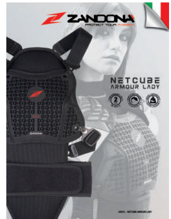
T. Display 2407/L