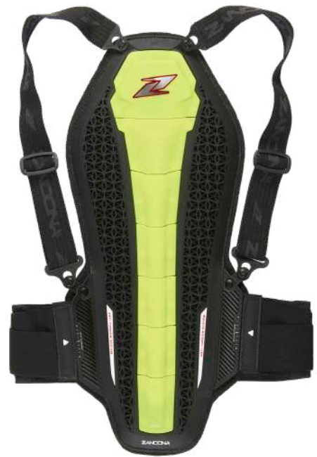
art. 1307-Yellow Fluo