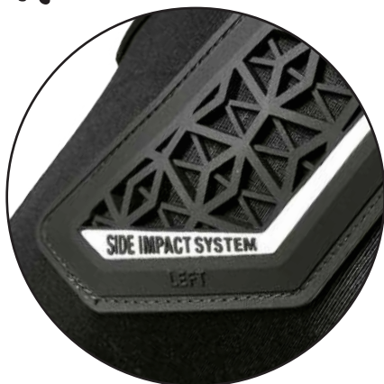
Side Impact System