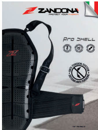
T. Display 1107