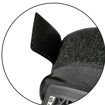
Anti-Stress TPU Strap