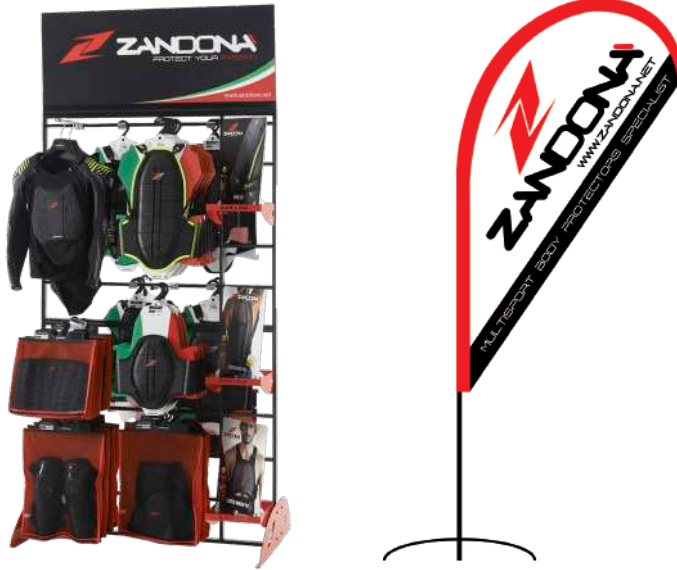
Signboard art. 9040