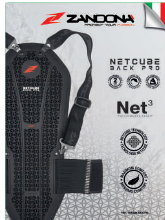
T. Display 1407