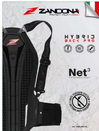
T. Display 1307